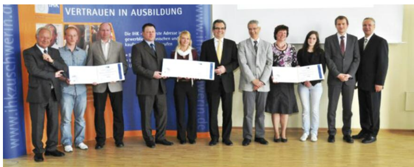
Gute Ausbildung bei NDB