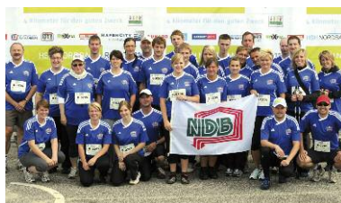
Gemeinsam etwas bewegen

721 Teams mit insgesamt 20.012 Teilnehmern liefen vier Kilometer zugunsten von „Kinder helfen Kindern“ durch Hamburgs junges Quartier im Herzen der Stadt. Dank der großartigen Beteiligung addierte sich der Betrag in diesem Jahr auf 127.500 Euro und die Gesamtspendensumme auf mehr als 750.000 Euro. Wir sind stolz darauf, dass NDB mit 29 Läufern und einer tollen sportlichen Leistung zu diesem Ergebnis beitragen konnte. Am 25.06.2011 um kurz nach halb neun starteten wir in Stade mit der S-Bahn in Richtung Hamburg. Vom Hauptbahnhof ging es mit dem Bus weiter zum Hamburg-Cruise-Center. Nachdem alle ihre NDB-Laufshirts angezogen hatten konnte es losgehen. Auf dem Weg zum „Start“ ent-