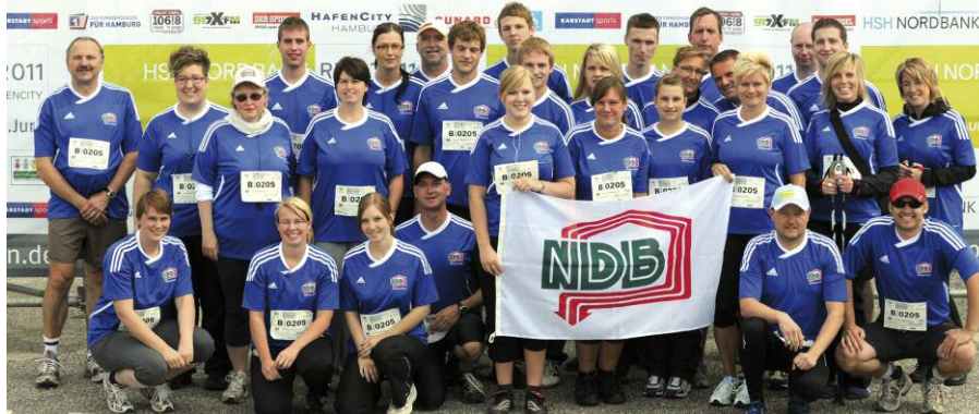
Am 25. Juni 2011 starteten 29 Läufer für einen guten Zweck... (Bericht auf Seite 3)