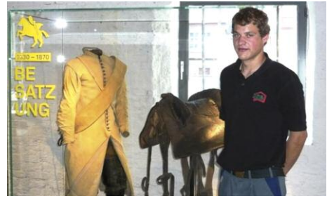
Ausstellung im neuen Gewand