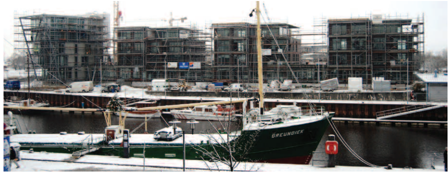
Wenn die Kräne weichen hat Stade ein einzigartiges Glanzstück.

Auch bei uns in Stade wird kräftig investiert. So entsteht direkt am Hafen ein komplett neuer Stadtteil, die „Salztorvorstadt“.