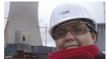
Aufmaße im Griff

Meine große Reise begann Anfang diesen Jahres. Das Ziel war eine unserer größten Baustellen, das Kraftwerk in Hamm. Als „Heldin der Aufmaße“ wollte ich unsere Monteure auf der Baustelle unterstützen und sie mit der Eingabe der Aufmaße in unser System unterstützen. Es ist immer wieder aufregend, auf die Baustellen zu fahren, die Abwechslung zu haben und die Erfahrungen zu sammeln, wie unsere Monteure dort die Woche über leben und arbeiten. Wenn man erst einmal gesehen hat wie