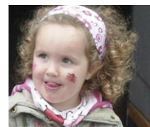
Ein Fest für alle