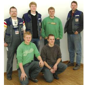
Ein Teil der Mannschaft

Wir haben es gehört und konnten es Tag für Tag beobachten. Ein neues Gebäude welches aus dem Boden gestampft wurde!